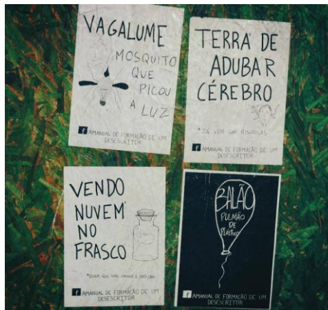
Figura 2 - Intervenção com Colagem

do livro e da poesia ter sempre um espaço restrito para seu consumo, como é o caso de bibliotecas e livrarias. Levando poesia para pessoas que não estão habituadas a ler esse tipo de conteúdo. A base das intervenções foi colar poemas em postes, muros e tapumes das cidades. O material era fotografado e posteriormente postado na página no Facebook homônima ao projeto.