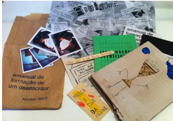
Figura 1 - Kit Amanual de Formação de um Desescriptor

A construção do livro busca o rompimento com o princípio estético do livro ser sempre uma unidade (entende-se por unidade neste caso o conteúdo de um determinado livro estar presente em apenas uma única unidade de livro) – como é a maioria dos livros (salvo o caso dos livros que são divididos em volumes) – para isso o Amanual se dividi em 4 livros: Desestatuto de Formação de um Desescriptor, Antes Tentativas Afrustradas de Desescrever, Informações Nutricionais, Tudo que Dicihonário; além de conter outros itens separados, como o caso de um poema em um palito de picolé, uma folha de Anúncios inventados, o Marca a dor da Página e os adesivos. Todos eles feitos de maneira artesanal pelo autor, num total de 300 exemplares numerados, embalados dentro de um saquinho de pão.