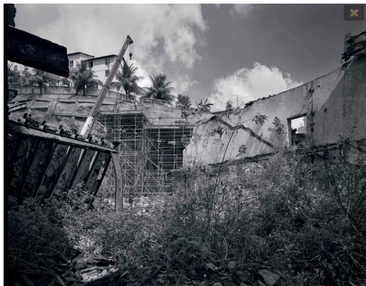
Fig. 4: Fotografia integrante da galeria “Evolução das obras no túnel da Saúde” (Cesar Barreto, s/d).

Cesar Barreto também registrou o que estou considerando como paisagens-ruínas, imagens que evocam simultaneamente ruínas do passado e do presente. A interferência na paisagem do presente cria ruínas a partir dos escombros das construções antigas. Algumas delas, contudo, já eram ruínas, edificações deterioradas pelo tempo e pela falta de conservação pelo poder público. As fotografias tanto retratam elementos “decadentes” da paisagem quanto “romantizam” os restos da destruição deixados pelas demolições. Vejamos um exemplo.