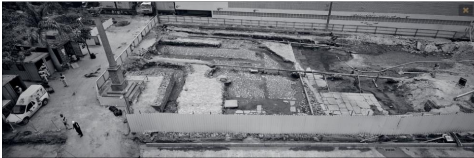
Fig. 5: Fotografia integrante da galeria “Barão de Tefê” (Cesar Barreto, s/d).