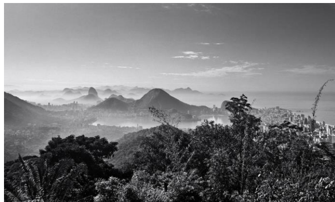
Fig. 1: “Manhã na Vista Chinesa” (Cesar Barreto, 1999).

De certo modo, as fotografias de Cesar Barreto corroboram com a ideia de uma paisagem idílica e sem conflitos, o que pode ter sido um dos motivos pelos quais ele foi escolhido para documentar o período “olímpico” do Rio de Janeiro. Em uma entrevista concedida ao jornal O Dia, a fala do fotógrafo possui relação justamente com a ideia de uma natureza monumental: “A beleza é o que me atrai, sou um voyeur ” (MAIA, 2013, on-line). A fotografia abaixo, que não integrava a fotogaleria especial do Cidade Olímpica , pois havia sido realizada previamente por Barreto, já revelava dessas algumas dessas características.