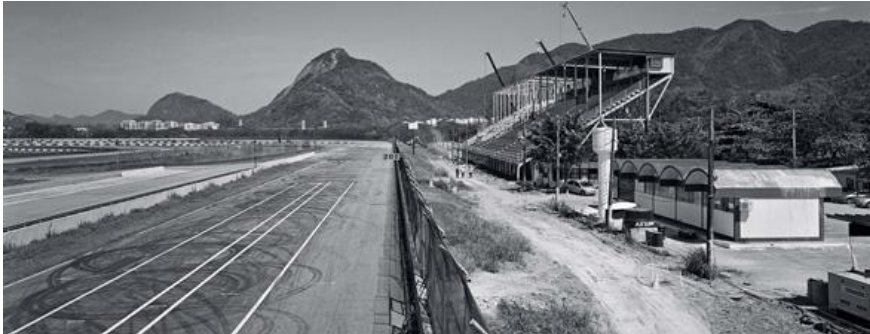
Fig.6: Foto integrante da galeria “Parque Olímpico” (Cesar Barreto, s/d).

Fonte: Internet Archive (imagem recuperada). Acesso em: 10 jan. 2018.