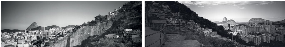
Fig. 3: As duas vistas do Pão de Açúcar colocadas lado a lado (Cesar Barreto, s/d).

Por outro lado, é difícil encontrar hoje ambientes que não tenham sido explorados ou modificados em algum nível pelo homem. Mesmo naqueles que parecem obras únicas da natureza, como cenas bucólicas de bosques, prados verdejantes e campos floridos, é provável que o ser humano tenha exercido alguma interferência, seja desviando o curso de rios, implodindo pedreiras ou cortando árvores para a abertura de pastos e estradas. Não obstante, as marcas dessas modificações na paisagem “natural” tendem a ser intencionalmente ignoradas pelos observadores, a menos que nela estejam presentes construções mais claramente ligadas à ação do homem, como é o caso das fotografias de Barreto tratadas acima.