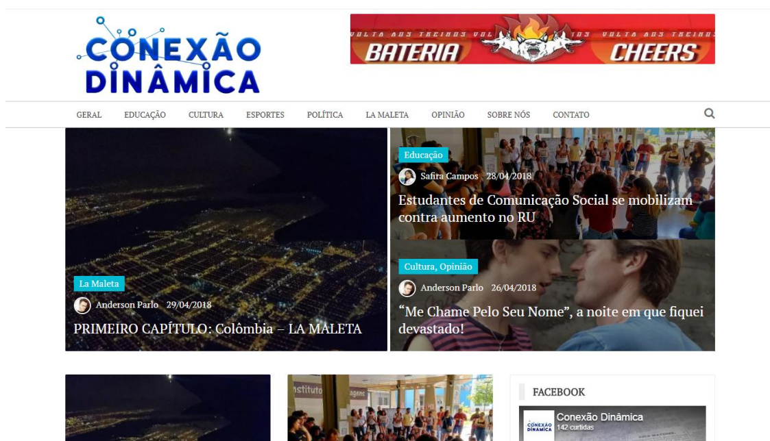
Figura 1: Página inicial do site Conexão Dinâmica

Após a contratação do domínio e da hospedagem do site, foi escolhido um layout que pudesse ser personalizado conforme a necessidade do projeto. Para isso, optou-se pelo tema ‘Newspaper Magazine’ oferecido no site ‘WpCodeFactory’ ( https://wpcodefactory.com/ ). Conhecimentos básicos das linguagens de programação HyperText Markup Language (HTML) e Cascading Style Sheets (CSS) foram necessários para que as adaptações idealizadas pela equipe fossem realizadas.