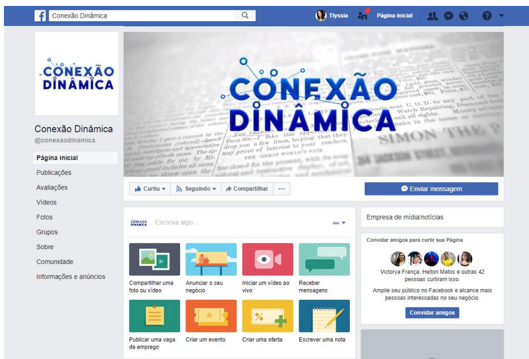
Figura 2: Página do Conexão Dinâmica no Facebook

Como forma de divulgação das matérias veiculadas no website, tendo em vista que a maior parte do público de interesse do site é usuária diária de redes sociais, foi criada uma página no Facebook (figura 2), que pode ser acessada em https://www.facebook.com/conexaodinamica/ . Além disso, os integrantes da turma compartilharam as publicações em suas contas pessoais, para que mais pessoas fossem atingidas.