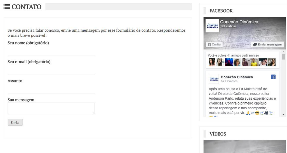
Figura 3: Aba contato

No que diz respeito à estrutura e divisão do website, sete categorias foram criadas a fim deixar mais claras as editorias e as produções especiais. Desse modo, as matérias do site são divididas em: Geral, Educação, Cultura, Esportes, Política, La Maleta e Opinião. No menu superior e principal do site, é possível encontrar ainda as abas Sobre Nós e Contato, que visam respectivamente apresentar os estudantes que contribuem para o site e possibilitar os leitores o envio de e-mails para a equipe.