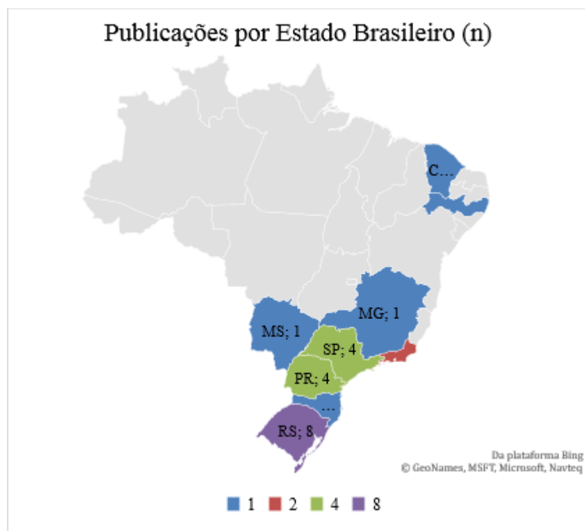
Gráfico 2 – Mapa de publicações por Estado Brasileiro (n)

Consultando a filiação de todos(as) os(as) autores(as) dos trabalhos têm-se um/uma autor(a) da França, 06 (seis) de Portugal e 23 do Brasil, distribuídos nos estados de acordo com o gráfico abaixo.