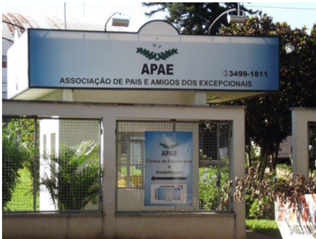
Figura 1 Fachada APAE de Santa Bárbara d' Oeste

desenvolvimento de seus filhos/amigos especiais. Com isso a instituição comemora seus 47 anos de existência, com 2.133 APAE'S no Brasil sendo 305 no estado de São Paulo.