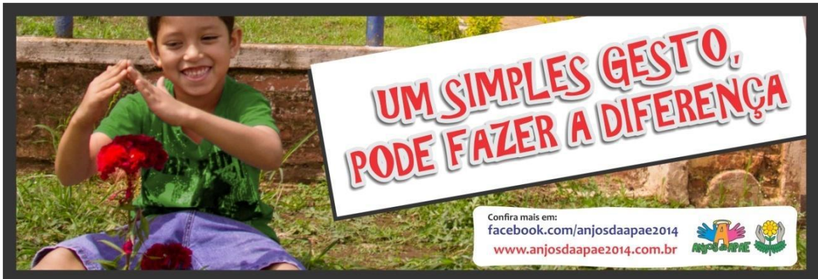
Figura 3 – arte da campanha APAE

Título: Um simples gesto pode fazer a diferença.