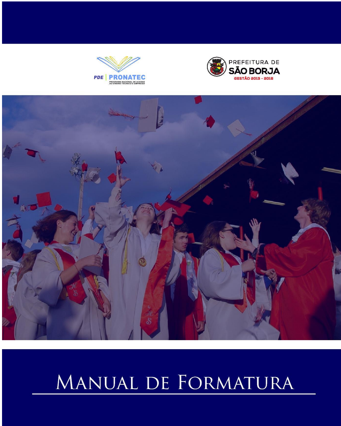
FIGURA 1: Capa do Manual de formatura

O conteúdo do manual foi dividido em tópicos seguindo etapas básicas para organização de eventos e teve a seguinte estrutura: Apresentação; A importância da cerimônia de formatura para instituição; Período da Formaturas; Atividades Preparatórias;