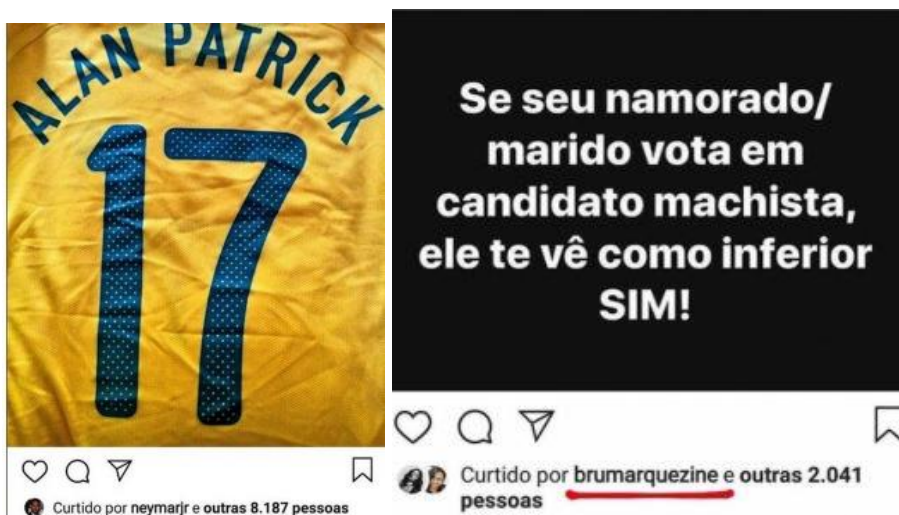
Figura 3: Bruna e Neymar curtem fotos de apoio/repúdio ao presidencial Bolsonaro