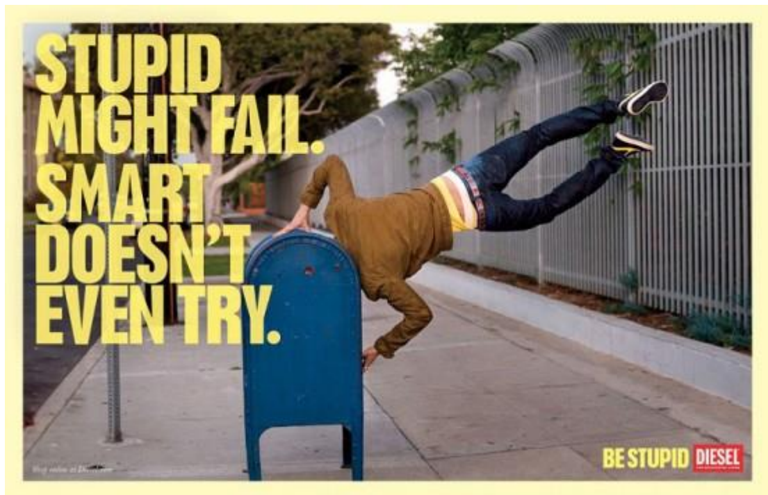
Figura 2 – Campanha Be Stupid

Relacionando a sociedade computadorizada com o objeto de estudo presente, no ano de 2010, foi lançado o slogan “Be Stupid” (Seja Estúpido), encorajando e incentivando seu público-alvo a participar da campanha, enviando vídeos de atitudes sem pensamento e sem reflexão. A veiculação da mídia impressa abordava fotos de pessoas reais em meio a modelos profissionais, equilibrando fotos despreziosas e irônicas com frases como: “Espertos dizem não, os estúpidos dizem sim”, “Espertos seguem a lógica, os estúpidos seguem o coração”, “Espertos são donos das melhores respostas, mas os estúpidos sempre fazem as melhores perguntas”, “Esperto tem planos, estúpidos tem histórias” e “O esperto pode ter cérebro, mas o estúpido tem coragem. Seja estúpido”. Já no slogan , é possível perceber a inserção do conceito de ironia. A base analítica será trabalhada por meio de algumas imagens da campanha “Be Stupid”.