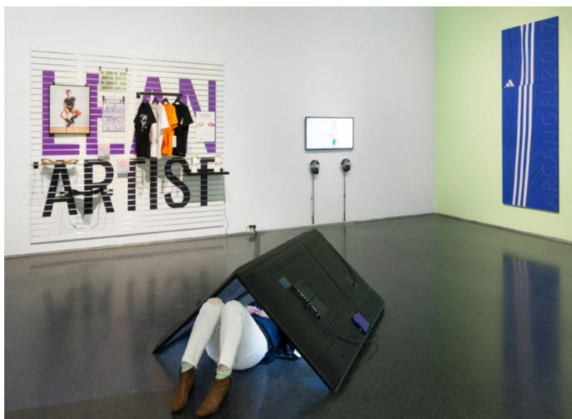
Figura 1 – Performance “imperiosa interação”