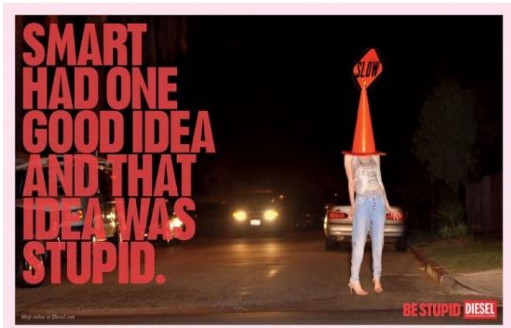
Figura 5 – Campanha Be Stupid

Acompanhando os acontecimentos da época e a geração, a marca Diesel propôs a participação do público em sua campanha de verão 2010. O consumidor pôde enviar ideias, montagens e conceitos que seriam considerados de atitudes estúpidas, resultando anúncios que traduziam a ironia e o humor e causando reações e identificação com o público consumidor da marca.