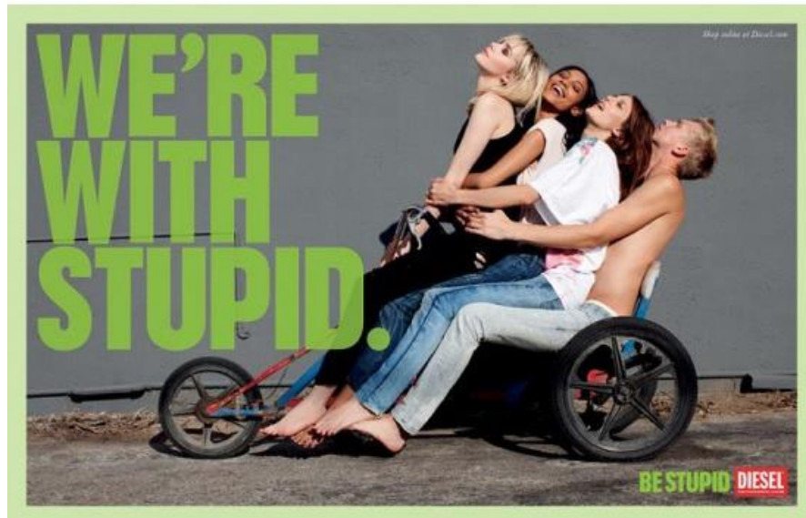
Figura 6 – Campanha Be Stupid