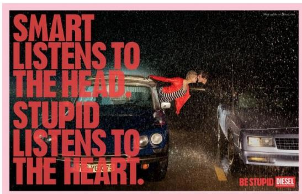
Figura 7 – Campanha Be Stupid

A outra imagem da campanha aponta a ironia com grande evidência, pois, através do slogan , os próprios sujeitos reconhecem a atitude estúpida e a admitem por meio da afirmação.